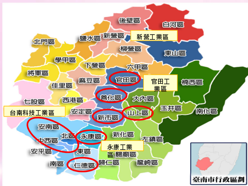
< 圖二 臺南市汽車零組件產業聚落分佈 >

臺南市的紡織產業產值佔全市工業產值四分之一強，織布產業聚落從官田往南至仁德一帶成為比較明顯的廊道，加上安南區也有不少的廠商群聚，紡織產業分佈密度最高地區分別為的將軍區、學甲區、仁德區、永康區等地。指標性廠商如 台南紡織 （東區、仁德區）、 佳和實業 （官田區）、 宏遠興業 （山上區）、 得力實業 （新市區）等。