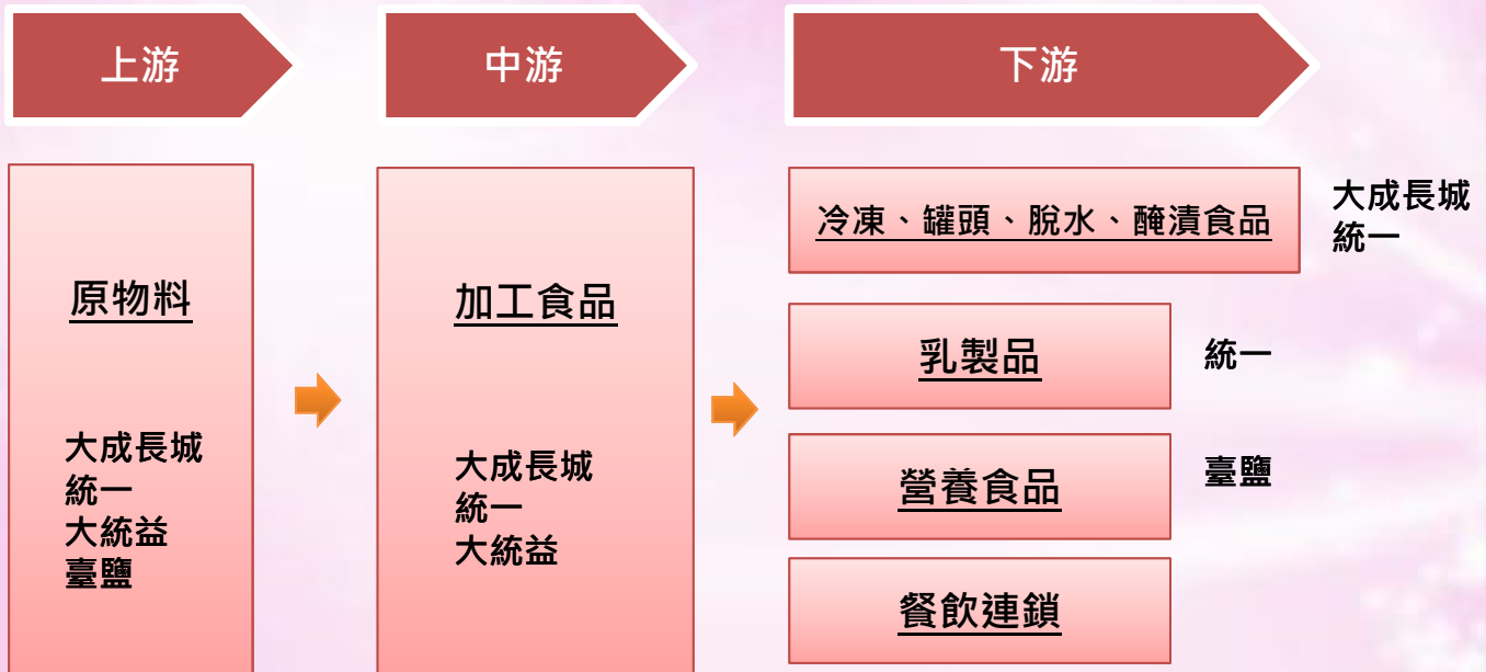
< 圖四 臺南市食品製造產業發展利基 >

食品產業鏈上游為黃豆、玉米、小麥、大麥、油菜籽、高粱、牛、羊、豬、雞等動、植物原物料，經加工製成穀、澱粉製品（如米、麥片、麵粉、玉米粉）、食用油脂、果糖、麥芽糖、冷凍肉品、冷凍蔬菜、豆類加工品（如豆腐、豆皮）等中間食品，然後再製成冷凍、罐頭、脫水、醃漬食品、乳製品、營養食品等可供消費者直接使用之食品。此外，餐飲通路亦為食品產業鏈下游之一環。